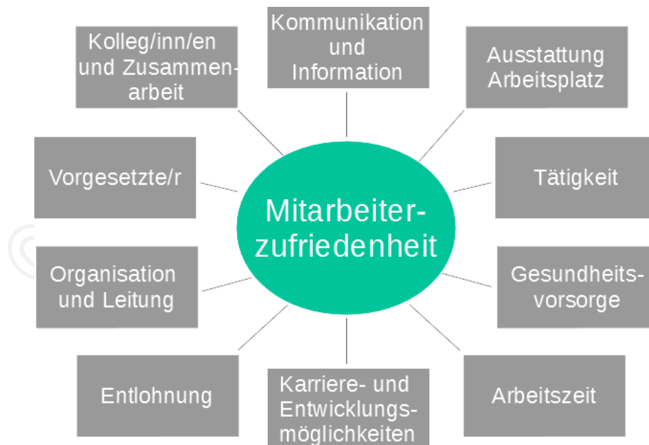
Abbildung 1: Dimensionen des Konstrukts ‚Mitarbeiterzufriedenheit‘

Mitarbeiterzufriedenheit lässt sich aus sozialwissenschaftlicher Sicht als ein (nicht direkt messbares) Konstrukt verstehen, das aus verschiedenen Dimensionen (z.B. Zufriedenheit mit der Tätigkeit, der Zusammenarbeit, den Führungskräften etc.) zusammengesetzt ist. Diesen einzelnen Dimensionen sind wiederum – meist mehrere – empirisch messbare Größen (Indikatoren) zugeordnet, deren jeweilige Ausprägungen mit Hilfe des Fragebogens erfasst werden. Beispielsweise werden zur Erfassung der Dimension Zufriedenheit mit der Tätigkeit Indikatoren wie ‚Zeitdruck‘, ‚Abwechslung‘, ‚Handlungsspielraum‘ und ‚Unterforderung‘ in Form von ausformulierten Fragen erhoben (z. B. Zustimmung zu den Aussagen „Ich stehe häufig unter Zeitdruck“, „Meine Tätigkeit ist abwechslungsreich“ etc.).